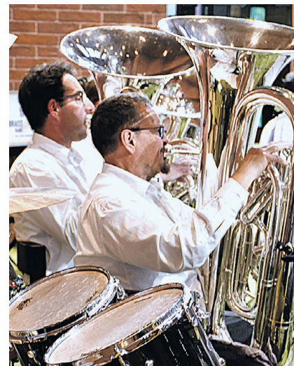
Zwei der insgesamt sechs Tubaspieler.

Mit «It Ain't Necessarily So» aus dem Opernstück Porgy and Bess, das ganz speziell endete, gaben die Musizierenden dann eine beeindruckende Zugabe. Erst nach einem weiteren Stück, nämlich «Born Free», facettenreich und gerne gespielt von der Brass Band, zogen die Blechmusiker unter grossem Applaus aus der Kirche. Danach verwöhnten sie die Gäste beim Apéro und genossen zusammen den Anfang in das Wochenende.