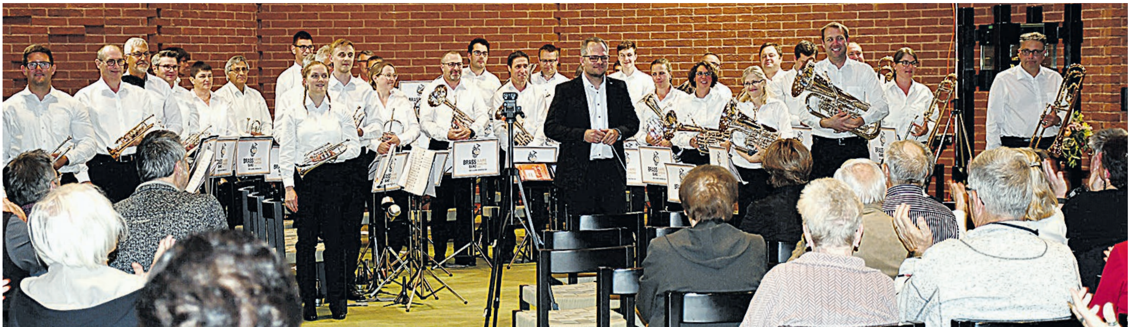
Nach dem gelungenen Frühlingskonzert nimmt die Brass Band Aare-Rhein den grossen Beifall entgegen.