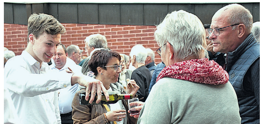
Auch nach dem Konzert verwöhnen die Musikanten die Gäste.